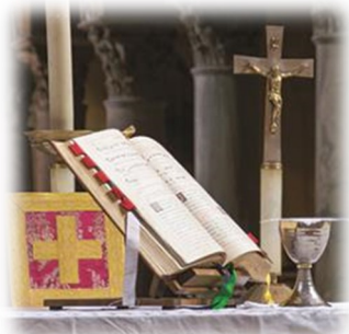
God our Father,