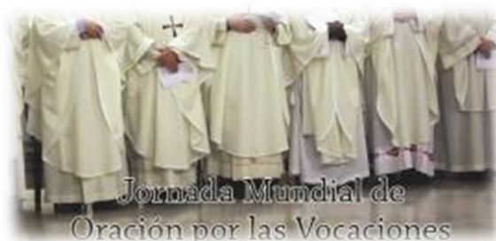
Dios nuestro Padre,

we thank you for calling men and women to serve in your Son's Kingdom as priests, deacons, and consecrated persons.